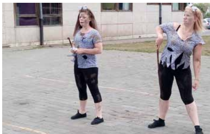
Gymnastique du matin

Les excursions sont toujours des moments forts. Cette année, nous avons découvert le Fourneau Saint-Michel (ce site est à lui seul une balade dans le temps) pour tester la pratique du torchis et la poterie. Mais « Août nous allons » aime honorer les traditions ! Luxembourg, avec son shopping et son souper au restaurant, n'a pas été boudé. Le bowling a également été programmé à Arlon où le personnel a tout mis en œuvre pour que chaque piste bénéficie d'une rampe de lancement pour les boules.