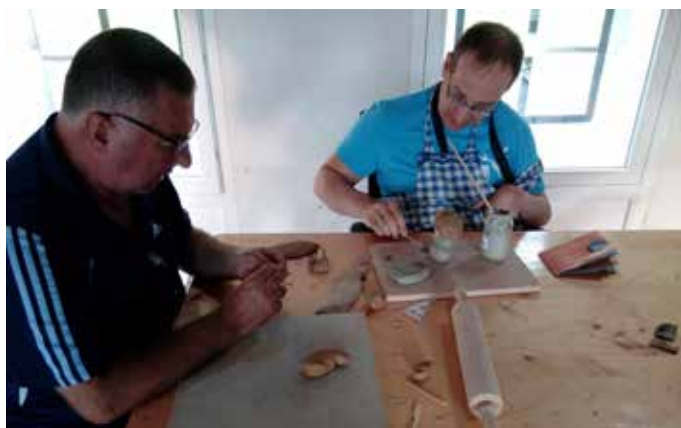
A l'abri du soleil

Ça y est, l'édition 2019 est lancée avec son fil rouge : « les couloirs du temps » !